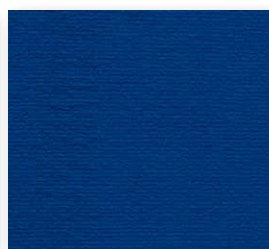
400+500 cm 77