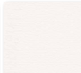
400+500 cm 32