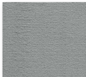
400+500 cm 93