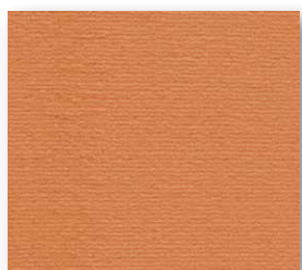
400+500 cm 58