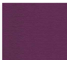
400+500 cm 69