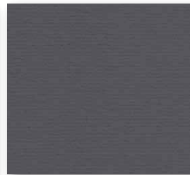
400+500 cm 97