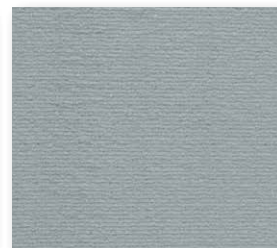
400+500 cm 95