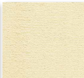
400+500 cm 30