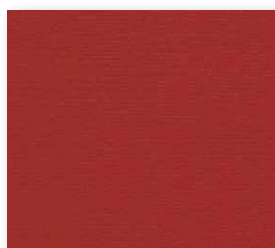
400+500 cm 10