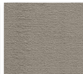
400+500 cm 47