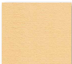
400+500 cm 52