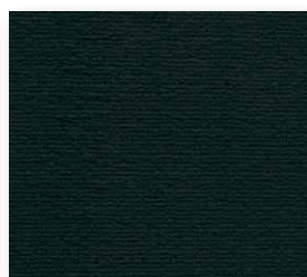
400+500 cm 98