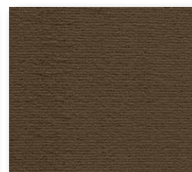
400+500 cm 49