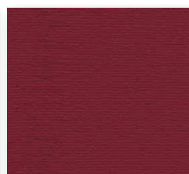
400+500 cm 16