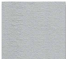
400+500 cm 92