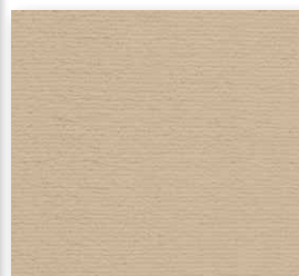
400+500 cm 37