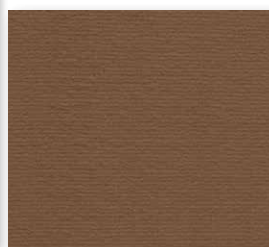
400+500 cm 41