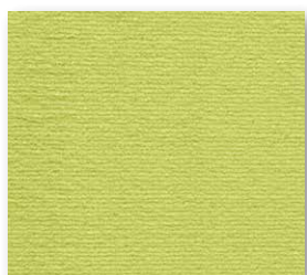
400+500 cm 26