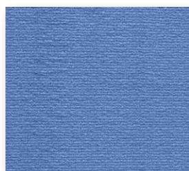
400+500 cm 70